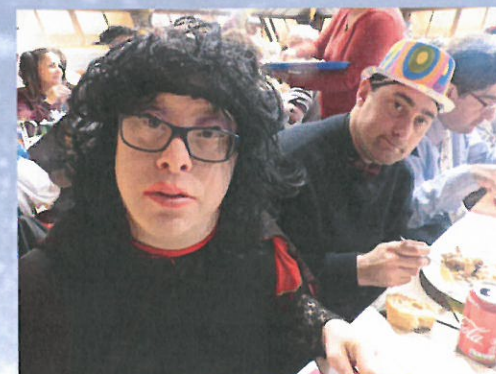
Repas déguisé et dansant à Allinges A la fête, il y avait, entre autres, Michel Polnareff, Astérix et la Reine des Neiges !