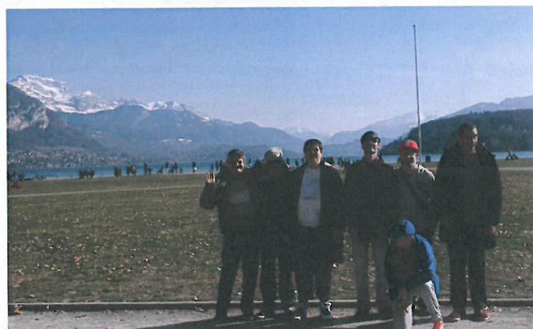
Fin février... 18° à Annecy !