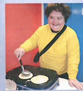
C'est la Chandeleur, on fait des crêpes !