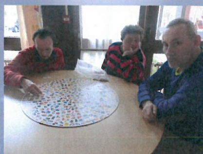
Après-midi musical, jeu, dessin, télévision, à chacun ses préférences le vendredi