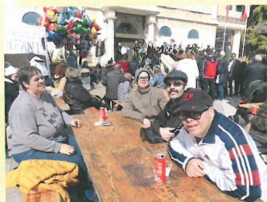
Ecouter les fanfares du carnaval d'Annemasse