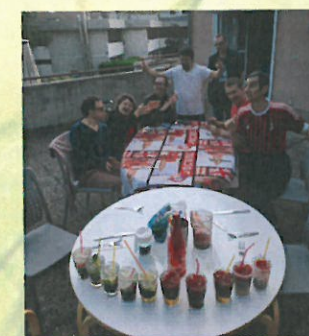
Repas convivial sur la terrasse, entre deux appartements du FJT