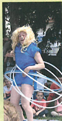
Bien rigoler pendant le spectacle du festival Frictions à Annemasse