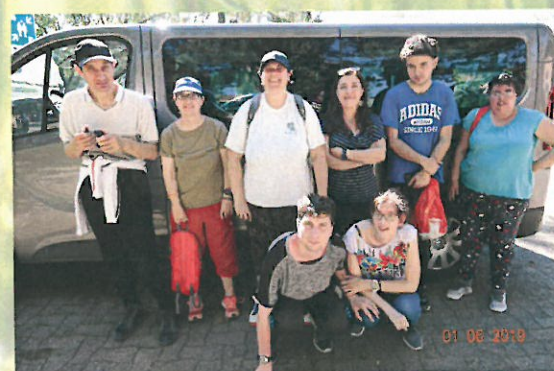
Ecouter la Nature au domaine de Guidou, conservatoire du littoral