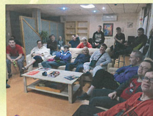
On se réunit le lundi soir et on met les infos de la semaine sur le panneau d'affichage.