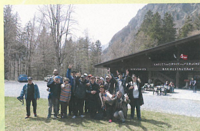
Manger un très bon repas de Pâques à Sixt Fer à Cheval