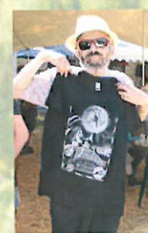
Jouer pendant le festival « A tue tête » au 648 café, et voir un joli spectacle d'acrobatie.