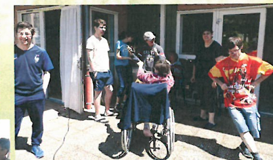
Au barbecue du jeudi de l'ascension, les grillades cuisent en musique