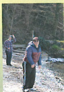
Faire des ricochets pendant la balade au domaine de Rovorée