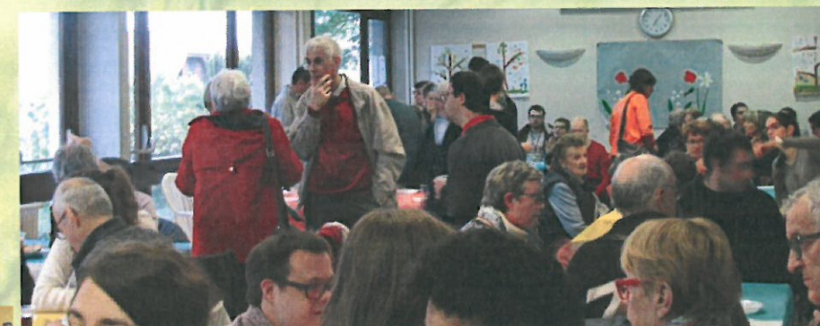
Un beau moment de partage pendant le barbecue avec les familles