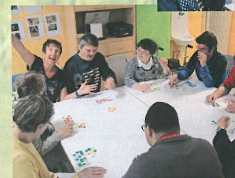
Pas de jambon à gagner mais de jolis porte-clés au loto de Pentecôte du FJT !