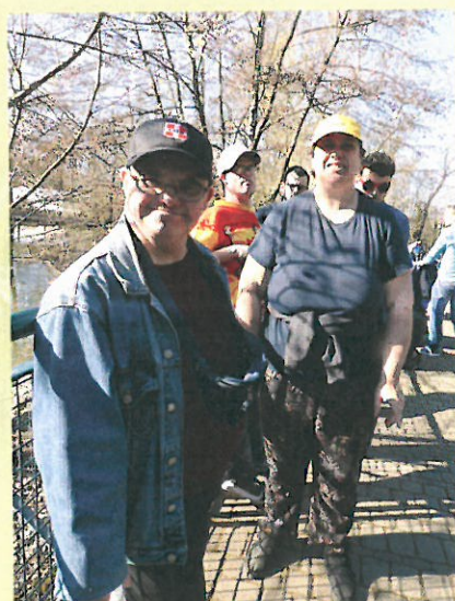
Voir les animaux et leurs nouveaux-nés au bois de la Bâtie à Genève